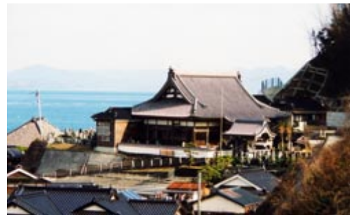
海雲山般若院向岸寺 室町前期の応永 8(1401)年、西福禅寺という禅宗寺院として開創。天文 7(1538)年、浄土宗忠譽英林上人により再興 松村賢正 (けんせい) 住職