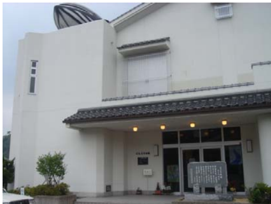
くじら資料館 平成 5(1993)年 捕鯨用具(国重文)