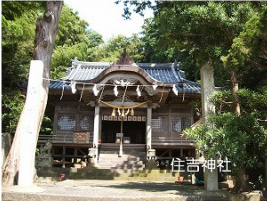
万治元(1658)年 6月29日造立 7/21-2 祭り