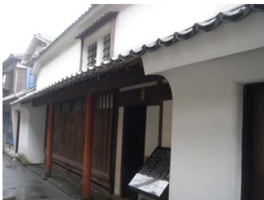
早川家(18世紀後半) 国重文