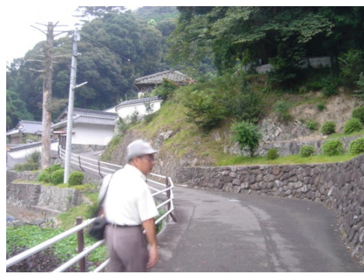
大日比の尼寺 法船庵(魚鱗の霊を弔うため娘たちを出家させた。100名を超える尼たちがいたという)