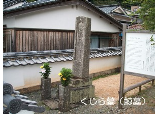
元禄 5(1692)年 向岸寺 5世 讃誉上人 清月庵 重文