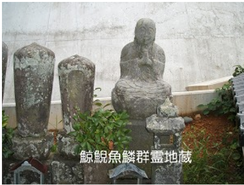
文久 3(1863)年 願主 早川家 13 源治右エ門 向岸寺