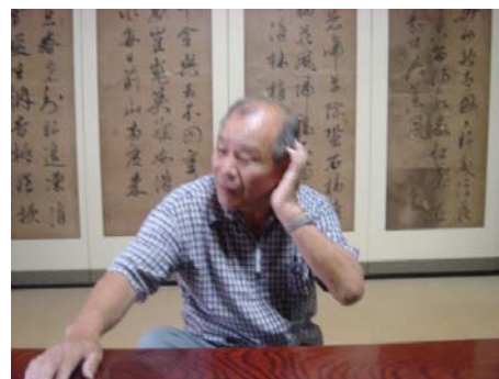
東京大学教養学部 1 年 岡田文弘作