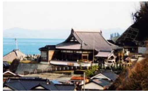
海雲山般若院向岸寺 室町前期の応永 8(1401)年、西福禅寺という禅宗寺院として開創。天文 7(1538)年、浄土宗忠譽英林上人により再興 松村賢正 (けんせい) 住職